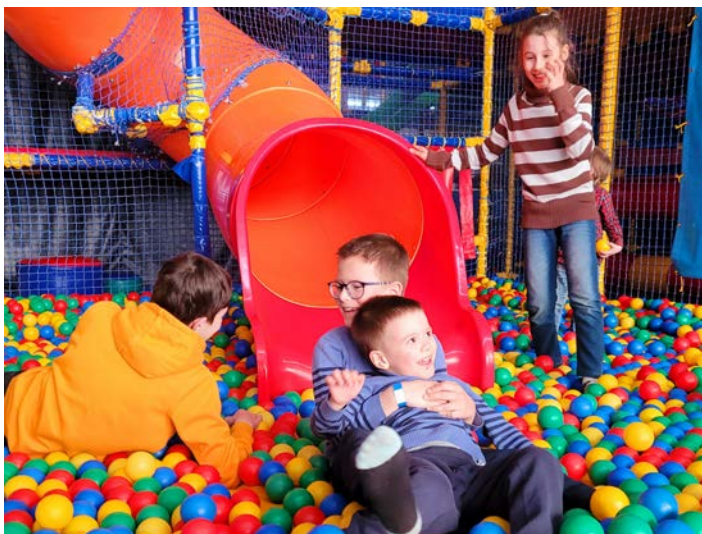
Sorgenfreies Spielen und Toben in der Rappelkiste

Im Übergangwohnheim in der Flämingstraße wohnen derzeit viele Kinder mit ihren Eltern.