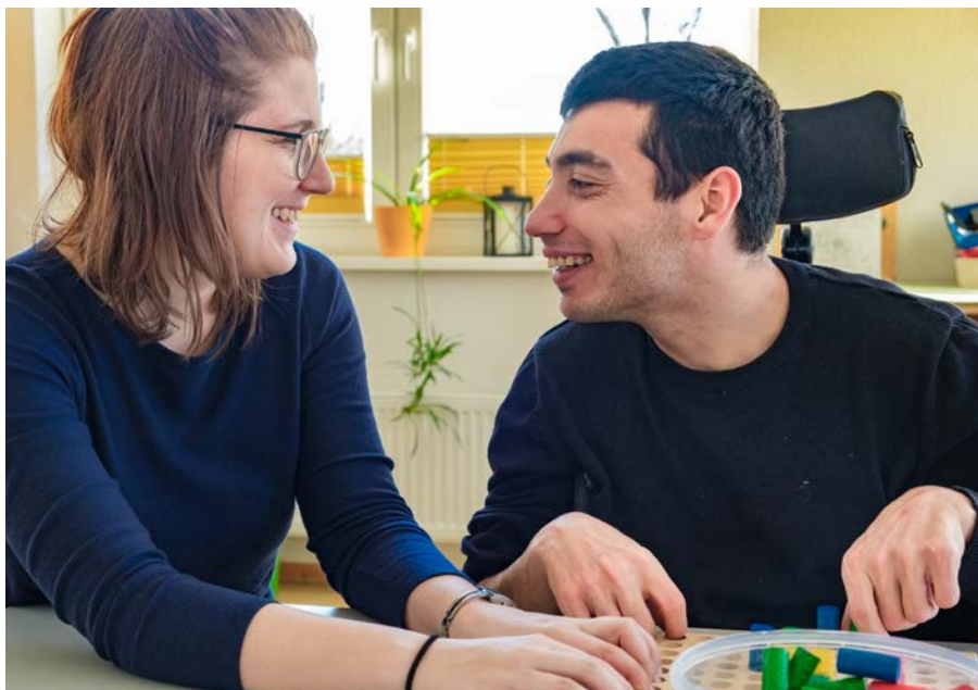
Die Stärkung von Teilhabe und Selbstbestimmung von Menschen mit Beeinträchtigungen steht im Fokus des Bundesteilhabegesetzes.

„Im Rahmen unserer Arbeit in der LIGA Brandenburg begleiten wir auf Landesebene fachlich die Umsetzung des